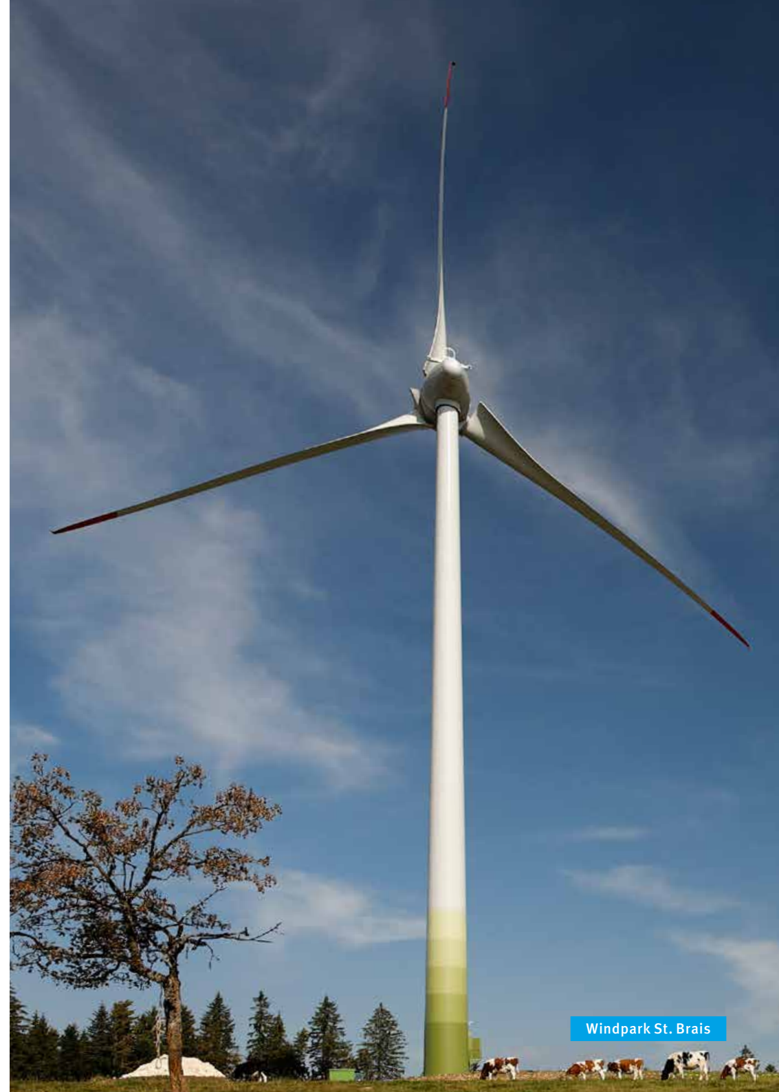
Windpark St. Brais

Bereits 1986 beteiligte sich die ADEV an der Finanzierung einer Windkraftanlage mit 30 kW Leistung. Die neusten, 2014 in der Schweiz in Betrieb genommenen Anlagen bringen es auf die 100fache Leistung. 2009 nahm die ADEV Windkraft AG im jurassischen St. Brais den ersten Windpark der Schweiz mit Bürgerbeteiligung in Betrieb. Windkraft ist ein wichtiger Pfeiler der erneuerbaren Stromversorgung: Im Winterhalbjahr, wenn wenig Solar- und Wasserstrom produziert wird, liefert die Windkraft rund 60 % ihrer gesamten Produktion. Die ADEV-Windkraftanlagen in der Schweiz und in Deutschland produzierten 2014 rund 7 Mio. Kilowattstunden Strom. Trotz guter Windpotenziale sind aufgrund Einsprachen neue Anlagen schwierig zu realisieren.